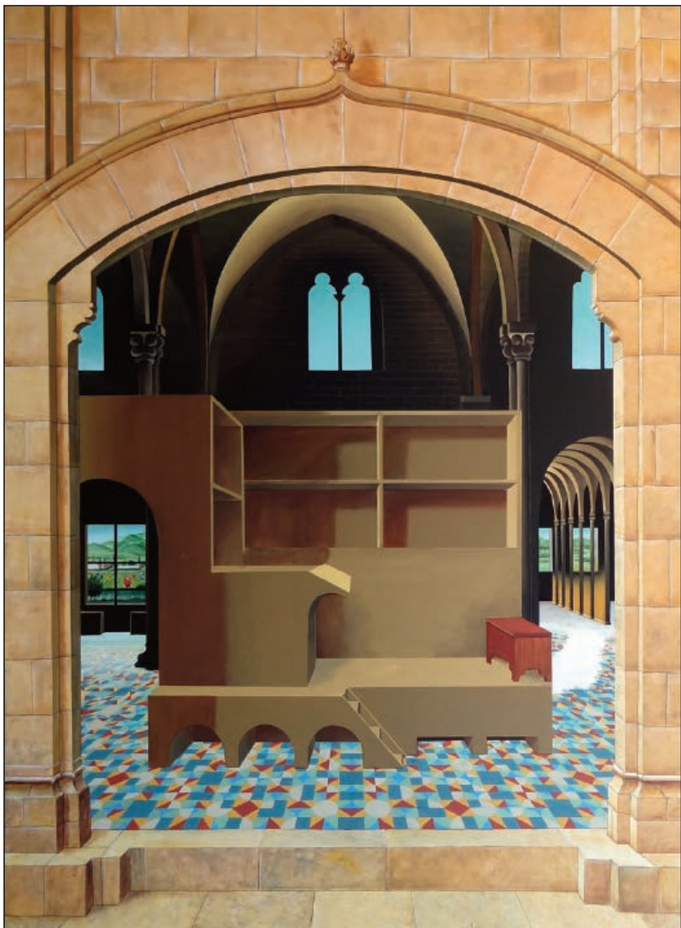
MEDITAÇÃO DE SÃO JERÔNIMO A ARQUITETURA COMO CENÁRIO © 2015 ANTONIO PETICOV